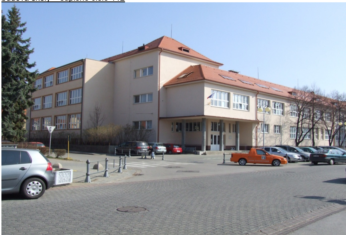
budova školy – súpisné číslo 112 – vchod Spojenej školy s vyučovacím jazykom maďarským